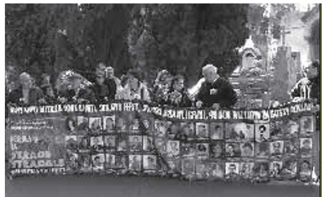
イタリアでの犠牲者の日の式典 2005年